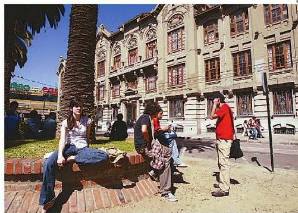
HOY LA FEDERACIÓN DARÁ A CONOCER MAYORES DETALLES DE LA MEDIDA DE PRESIÓN Y SUS MOTIVACIONES.

En tanto, los diputados Juan Luis Castro (PS) y Marco Antonio Núñez (PPD) pedirán hoy a