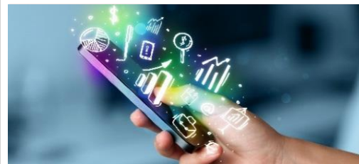
Soluciones de movilidad