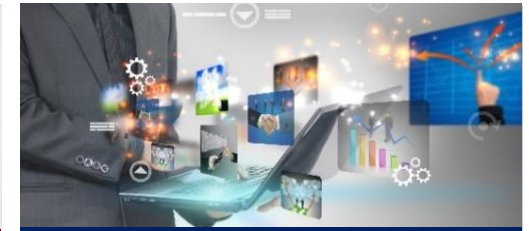
Design de la experiencia del usuario