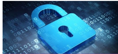
Seguridad de información