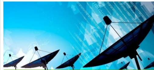
Servicios de Telecomunicaciones